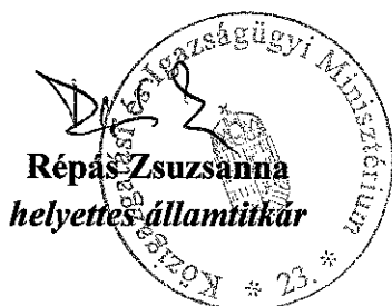
Répás Zsuzsanna helyettes államtitkár

A Bizottság elfogadta a 10/2012. (III. 5.) sz. határozatot .